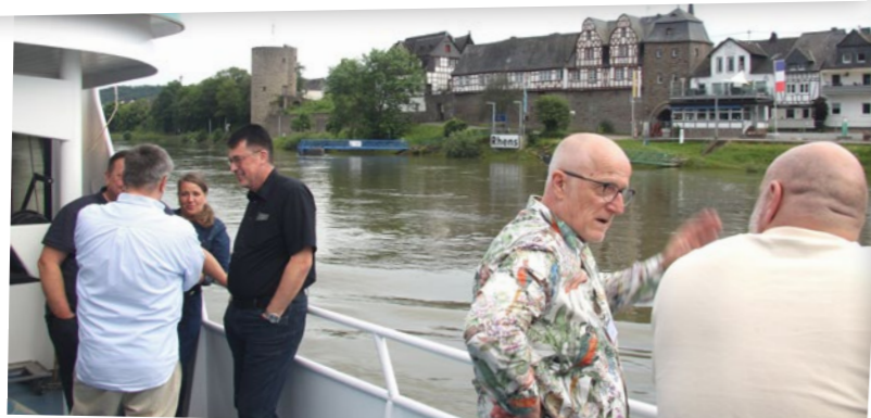
Andere Perspektive: Flussfahrten entschleunigen manchen sonst sehr flotten Alltag - und an Deck zeigt sich eine Welt jenseits von Bankentürmen und ICE-Strecken.