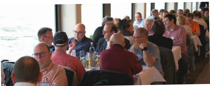
... die Themen des Tages konnten weitergesponnen werden, ebenso wie kleine und große andere Projekte angedacht wurden. Schließlich arbeiten viele Betriebe bundesweit verteilt, und da ist örtliche „Besprechung“ eine manchmal seltene und deshalb geschätzte Gelegenheit.