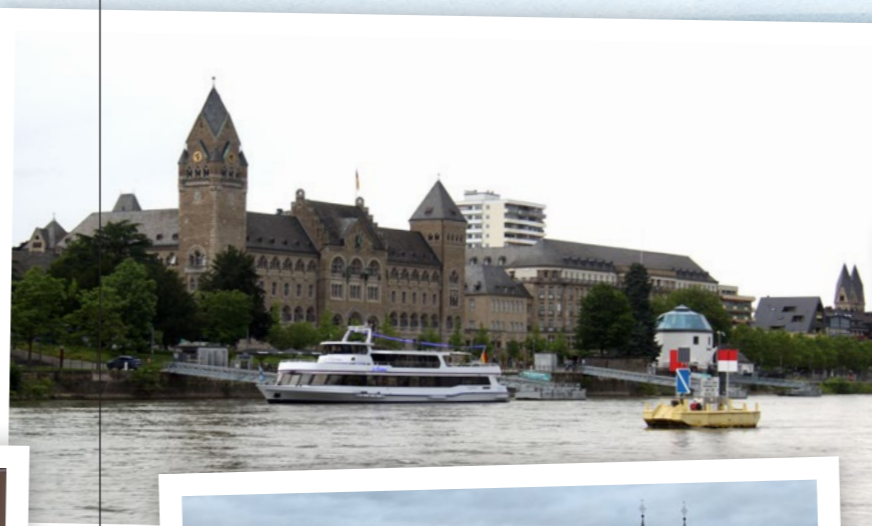
Start und Ziel: Koblenz grüßt von der Wasserseite ...