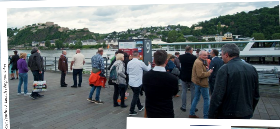
Vorfreude: Per Schiff legten wir vom Koblenzer Rheinufer ab zur stimmungsvollen Abendfahrt mit vielen Ausblicken - wie hier schon links oben zur Festung Ehrenbreitstein ...