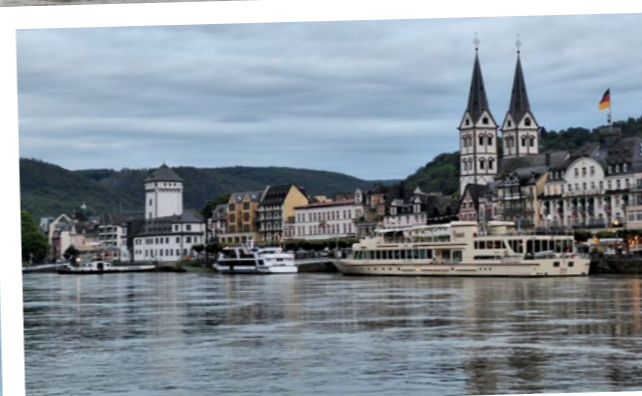
... fuhren wir nach Boppard inmitten von Weinhängen ...