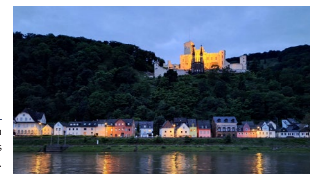
... und passierten auf dem Rückweg Schloss Stolzenfels in der blauen Stunde.