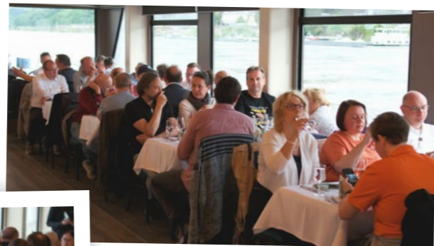
... in guter rheinischer Gastlichkeit war viel Raum und Zeit für den Austausch gerade mit den Kolleginnen und Kollegen, die frau oder man sonst kaum sieht ...