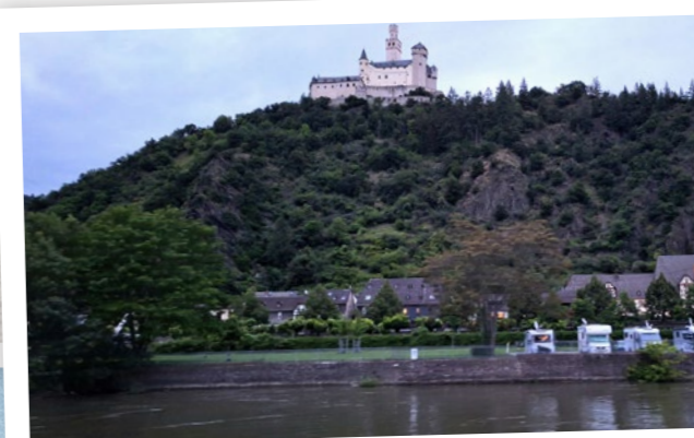
... vorbei an der Marksburg oberhalb von Braubach ...